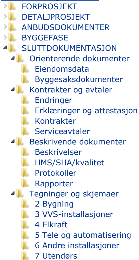
Figur 2 Eksempel på mappestruktur basert på Tabell 3